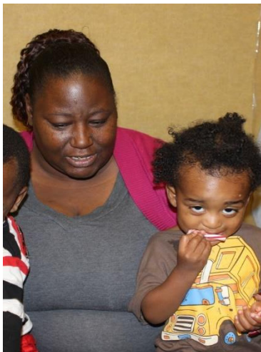
ACRC Santa Day 2014