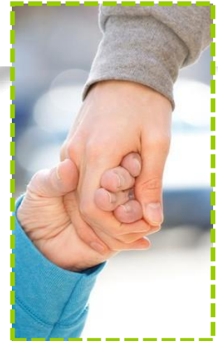
Creative Commons, 2019