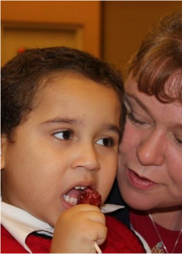
ACRC Santa Day, 2014

Оценка услуг временной помощи основана на потребностях клиента, и определяется при сравнении нужд клиента с такими же у обычного ребенка/взрослого в таком же возрасте. ACRC будет оплачивать услуги временной помощи поквартально. Соответствующее количество часов временной помощи для каждой семьи основано на оцененной необходимости с учетом потребности ребенка или взрослого, поведения и возможностей других ресурсов общего назначения (т.е., программу раннего и периодического обследования, диагностики и лечения (Early and Periodic Screening, Diagnostic and Treatment, EPSDT), программу Nursing Facility Waiver, школу, дошкольное детское учреждение, пр.)