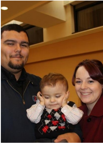
ACRC Santa Day, 2014

Временная помощь квалифицированной медсестры может оплачиваться через программу Medi-Cal для клиентов от 0 до 21 года в соответствии с программой раннего и периодического обследования, диагностики и лечения (EPSDT). Услуги также могут быть оплачены при помощи программы Nursing Facility Waiver. Если услуги временной помощи предоставляются Агентством по уходу на дому (Home Health Agency, ННА), то агентство может сотрудничать с Medi-Cal и другими агентствами штата, чтобы оплатить временную помощь квалифицированной медсестры. Если клиенту рекомендовано посещать Дневной центр здоровья для детей (Pediatric Day Health Center), то сотрудники этого центра могут сотрудничать с SC и членами семьи, чтобы записать клиента в этот центр EPSDT, и также обеспечить оплату этих услуг через EPSDT. ACRC может оплатить услуги для клиента после утверждения Комитетом наилучшей практики (Best Practices Committee). Это временное финансирование обусловлено согласием семьи задействовать все доступные ресурсы общего характера, в том числе включение в программу Medicaid Waiver.