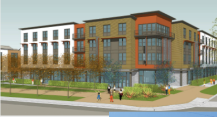
ਜਲਦ ਆ ਰਿਹਾ ਹੈ! ਨਵੰਬਰ 2022

ਰਿਚਰਡਜ਼ ਬੁਲੇਵਾਰਡ 'ਤੇ ਡਾਊਨਟਾਊਨ ਸੈਕਰਾਮੈਂਟੋ ਦੇ ਬਿਲਕੁਲ ਉੱਤਰ ਵਿੱਚ ਸਥਿਤ, ਮਿਰਾਸੋਲ ਵਿਲੇਜ ਡਿਵੈਲਪਮੈਂਟ (Mirasol Village Development) ਕੋਲ ਖੇਤਰੀ ਕੇਂਦਰ ਦੇ ਗਾਹਕਾਂ ਲਈ 15 DDS-ਫੰਡਡ ਯੂਨਿਟ ਹਨ। ਕਿਰਾਇਆ ਅਤੇ ਸਹੂਲਤਾਂ ਦੇ ਖਰਚਿਆਂ ਨੂੰ ਗਾਹਕ ਦੀ ਆਮਦਨ ਦੇ %30 'ਤੇ ਸੀਮਿਤ ਕੀਤਾ ਜਾਂਦਾ ਹੈ। ਲਗਭਗ 30 ਪਹਿਲਾਂ ਪਛਾਣੇ ਗਏ ਖੇਤਰੀ ਕੇਂਦਰ ਦੇ ਗਾਹਕ ਅਕਤੂਬਰ 2022 ਵਿੱਚ ਅੰਤਿਮ ਚੋਣ ਪ੍ਰਕਿਰਿਆ ਵਿੱਚੋਂ ਲੰਘ ਰਹੇ ਹਨ। ਪਹਿਲੀ STEP ਹਾਊਸਿੰਗ ਐਕਸੈਸ ਸਰਵਿਸਿਜ਼ ਬਿਨੈਕਾਰਾਂ ਦੀ ਸਹਾਇਤਾ ਕਰ ਰਹੀ ਹੈ ਜਦੋਂ ਉਹ 15 ਯੂਨਿਟਾਂ ਵਿੱਚੋਂ ਇੱਕ ਲਈ ਅਰਜ਼ੀ ਦੇਣ ਲਈ ਲੋੜੀਂਦੇ ਦਸਤਾਵੇਜ਼ ਇਕੱਠੇ ਕਰ ਰਹੇ ਹਨ।